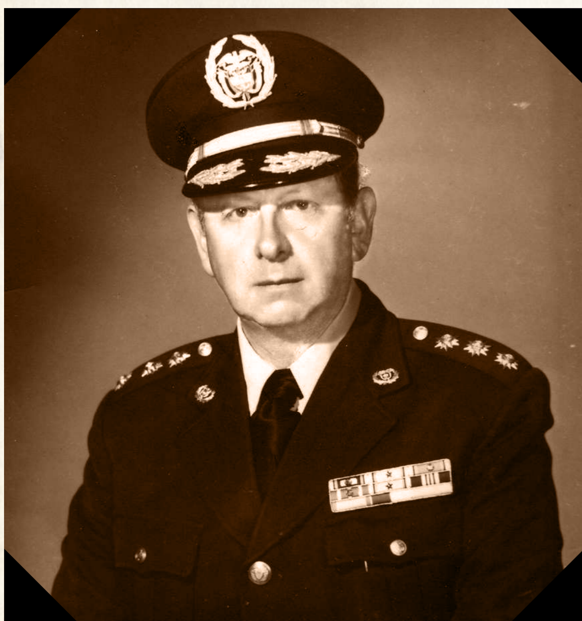
General Luis Camacho Leyva Razón, nervio y origen de la idea, 1976

Posteriormente, en 1978, como fruto de la concepción idealista de un grupo de médicos del Hospital Militar Central, empezó la conformación de la Escuela de Medicina y Ciencias de la Salud, lo que permitió iniciar labores durante el primer semestre de 1979.